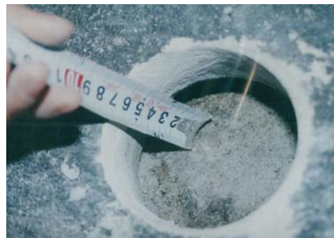
● 背面の空洞化調査