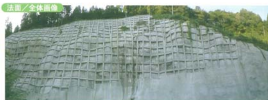
● 地上連続撮影画像